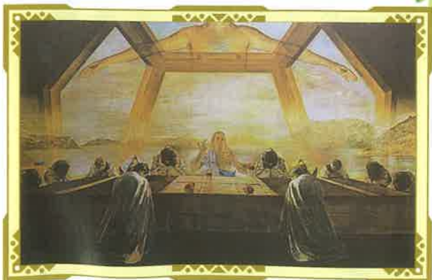
ダリのリトグラフ