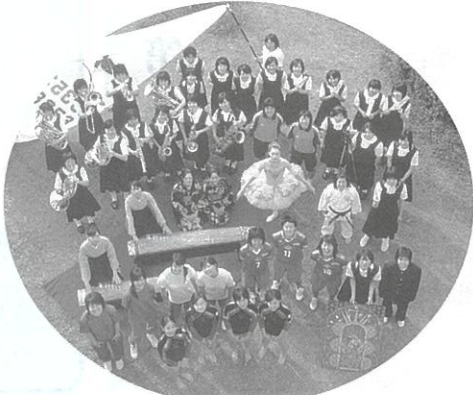
一人ひとり、みんなヒロインになる

生徒達は、一人ひとり思いがけない才能を秘めています。自分の才能を発見し、伸び伸びと育てる三年間。